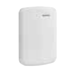
3G8080/ 3G8080(I) Comunicador de Alarma Celular HSPA Compatible con ALARM.COM®