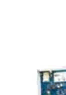
TL2803G/ TL2803G(R) Comunicador de Alarma de Doble Trayector via Internet y HSPA