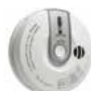
PGx913 Detector de CO Inalámbrico PowerG (solo en EE.UU.)