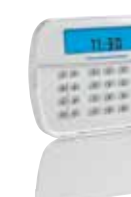
HS2ICNRFx/ HS2ICNRFx Teclado Cableado con Iconos, Transceptor PowerG Integrado y Credencial de Proximidad Opcional