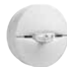
PGx916 Detector de Humo y Calor Inalámbrico PowerG