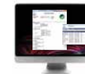
Software de Gestión de Rutina del Sistema (RSM)