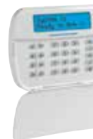
HS2LCDWFPx / HS2LCDWFPx / HS2LCDWFPVx Teclado LCD Alfanumérico Inalámbrico de 2 vías PowerG sin Cables con Credencial de Proximidad y Comandos por Voz Opcionales