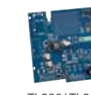
TL280/ TL280(R) Comunicador de Alarma via Internet