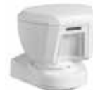
PGx994 Detector de Movimiento PIR Exterior Inalámbrico PowerG