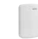
CD8080/ CD8080(I) Comunicador de Alarma Celular CDMA compatible con ALARM.COM®