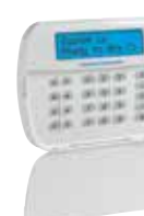
HS2LCD/ HS2LCDP Teclado LCD Alfanumérico con Soporte Opcional para Credencial de Proximidad