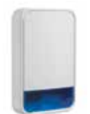
PGx911 Sirena Exterior Inalámbrica PowerG