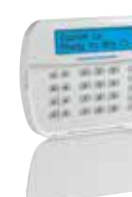
HS2LCDRFx/ HS2LCDRFPx Teclado LCD Alfanumérico con Transceptor PowerG Integrado y Credencial de Proximidad Opcional