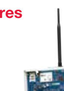
3G2080/ 3G2080(R) Comunicador de Alarma Celular HSPA