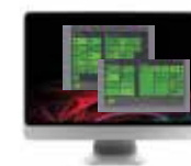
Software WebSA System Administrator