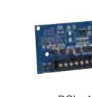
PCL-422 Módulo para Montaje Remoto del Comunicador