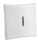
HSM2HOSTx Módulo Transceptor PowerG con Función de Host