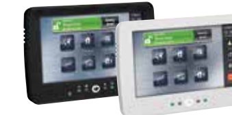
HS2TCHP Teclado de Pantalla Táctil Cableado de Siete Pulgadas con Credencial de Proximidad en Blanco y Negro