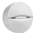
PGx926 Detector de Humo Inalámbrico PowerG