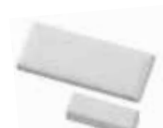
PGx975 Contacto de Puerta/Ventana Inalámbrico PowerG en Blanco y Marrón