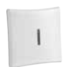
PGx901 Sirena Interior Inalámbrica PowerG