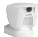
PGx944 Detector de Movimiento PIR Exterior con Cámara Incorporada