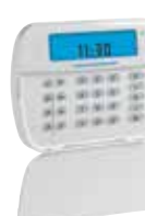
HS2ICN/ HS2ICNP Teclado Cableado ICON con Soporte Opcional para Credencial de Proximidad